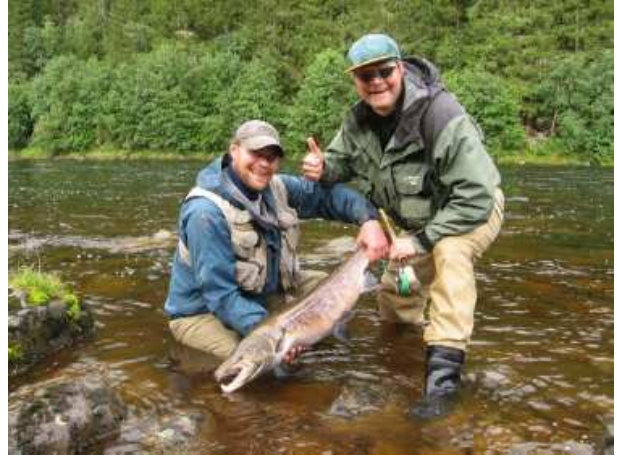
Lycklig som en kalv på grönbete.