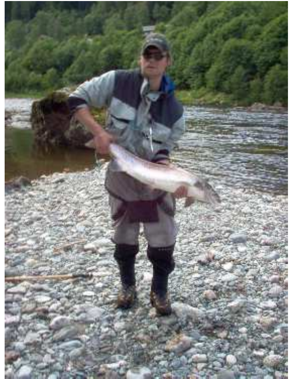
Nervöst! Första tailade stora gästlaxen.