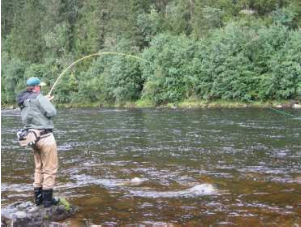
Guleböj! En argsint lekfärgad hanlax får det att knaka ända ner i korken.